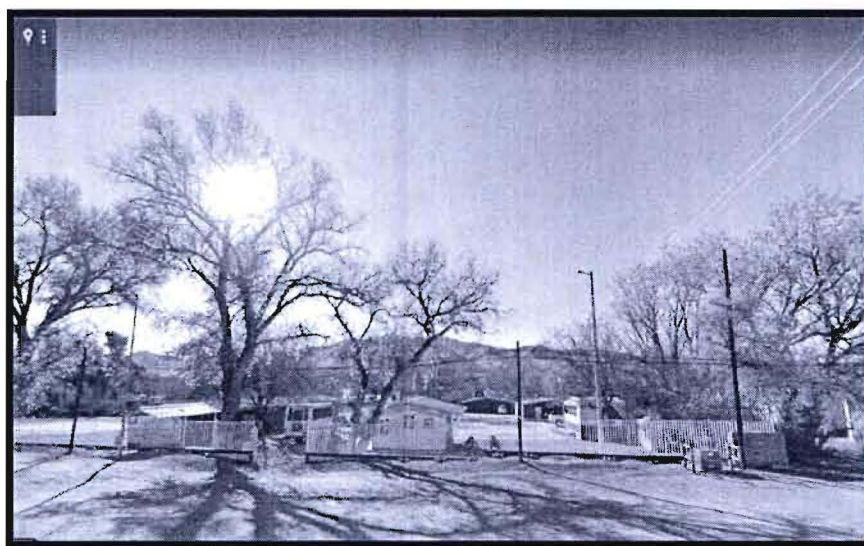
Escuela Primaria Rural Abelardo L. Rodríguez, fundada en el año 1964, en la Localidad Rural de Cíbuta, municipio de Nogales, Sonora

Con respecto a lo anterior, y por el valor que representan estas Instituciones para la educación en nuestra Entidad, es por demás justo y equitativo que se fortalezca su infraestructura con la construcción de tejabanos, no solo por el valor histórico que representan y porque han puesto muy en alto a la educación en Sonora, sino porque así nos lo han reclamado sus directivos y padres de familia, y porque al igual que la mayoría de las escuelas sonorenses, merecen contar con instalaciones apropiadas que contribuyan al desarrollo armónico y de calidad de sus alumnos.