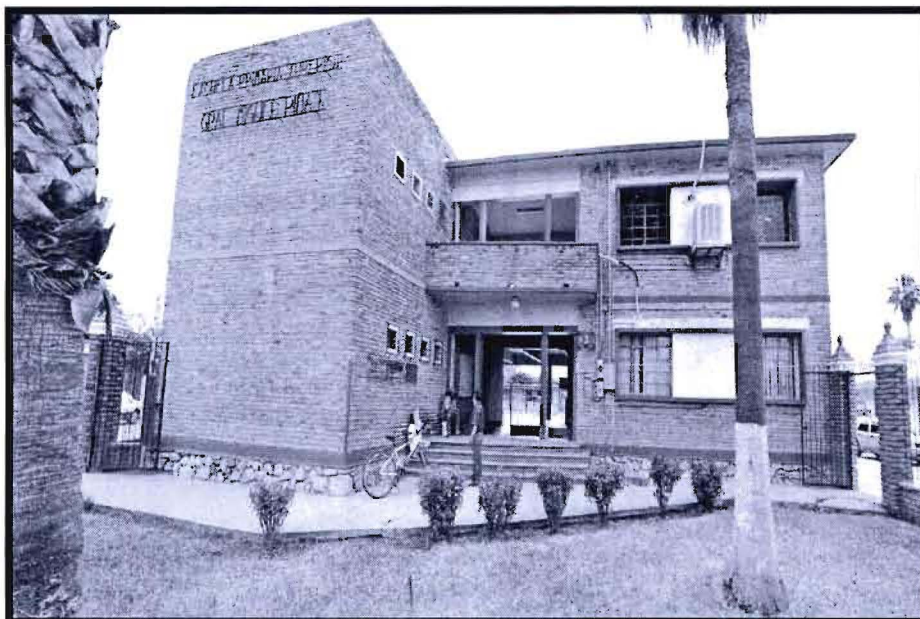
Escuela Secundaria Gral. Miguel Piña n.- 5, fundada en el año 1942, en la Heroica Ures, Sonora